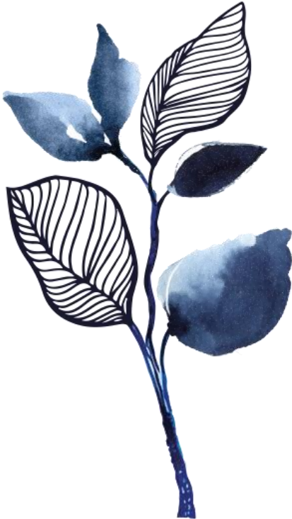
Odłona BLUE FLOWER