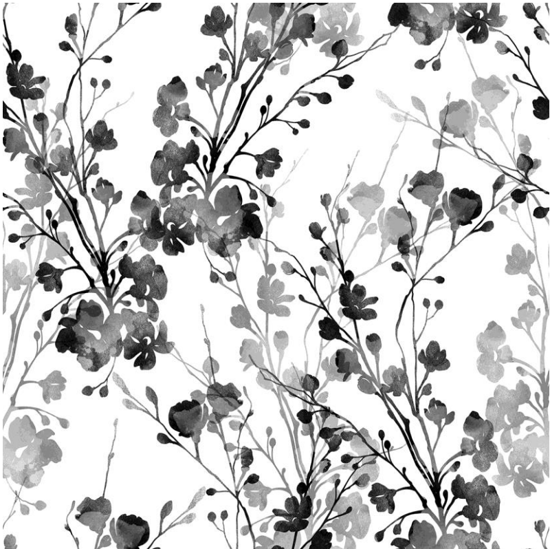
Odłona 1 – BLACK NATURE